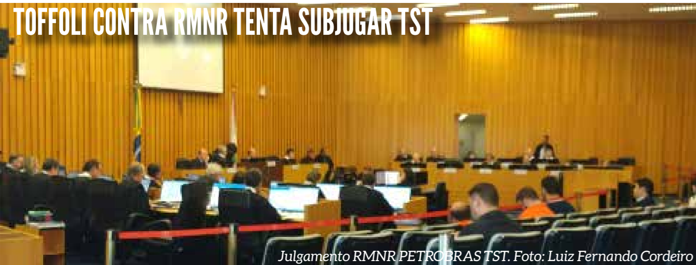
Julgamento RMNR PETROBRAS TST.

O Ministro Dias Toffoli, do Supremo Tribunal Federal (STF), concedeu nesta sexta-feira (27) uma liminar em caráter provisório para suspender os efeitos da derrota judicial sofrida pela direção da Petrobrás no Tribunal Superior do Trabalho (TST), em 21 de junho, por decisão do plenário do TST. O fato é que, erroneamente, intencionalmente ou não, alguns veículos de comunicação, como o jornal o Estado de São Paulo, por exemplo, dizem que o processo trabalhista pede o recálculo de um acordo coletivo de 2007 que concedeu adicionais ao salário, como trabalho noturno, por sobreaviso e confinamento.