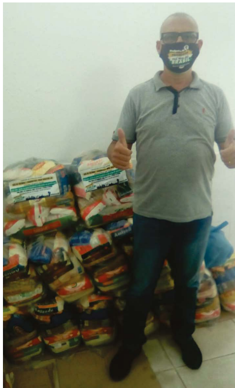
São Gonçalo: máscaras e cestas básicas chegaram ao Morro do Abacatão e Morro do Feijão