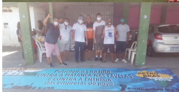
Petroleiros juntos com o povo contra a privatização da Petrobrás