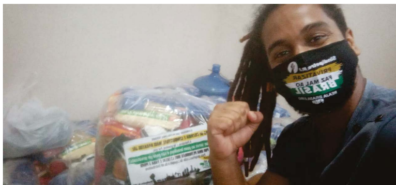
Coletivo de Estudos Orosina Viera na Maré

“ Não conheço vocês, mas agradeço tudo que fez por mim ”