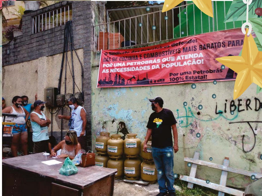
Petroleiros com o povo: entrega de botijões em Camarista Méier