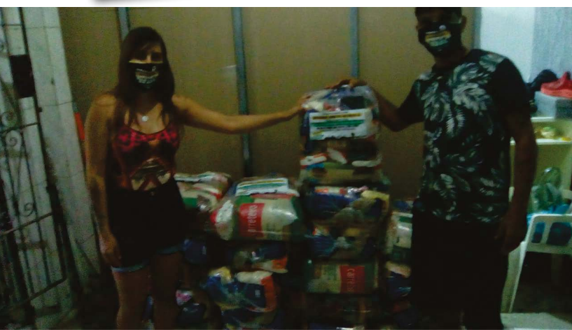
Morro do Abacatão em São Gonçalo

Favela da Galinha: todas as cestas são entregues com adesivo informativo sobre a campanha em defesa da Petrobrás