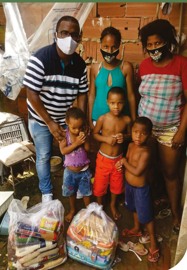
Rua Dique no Jardim América