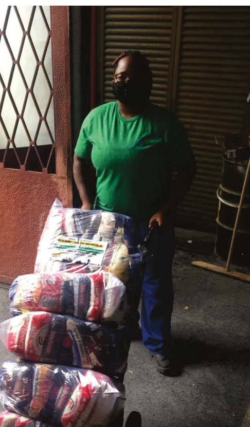
Coopama - Cooperativa Popular Amigos do Meio Ambiente