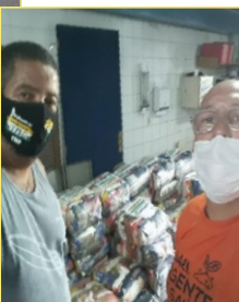
Doação de cestas básicas

Essa parceria foi muito fortalecida com a Campanha Solidariedade Petroleira! Desde maio de 2020, o SindipetroRJ doou cestas básicas aos mais necessitados através da Associação. Em 2021, o Sindicato começou a apoiar o projeto de coleta de óleo de cozinha que visa à preservação do meio ambiente, à geração de renda e à educação ambiental. Em todos os momentos, as campanhas "O Petróleo é nosso", "Petrobrás 100% estatal e para o povo", a defesa da Petrobrás Biocombustível, entre outras, permeiam essa parceria e o diálogo do Círculo Laranja com seus associados e parceiros em geral.