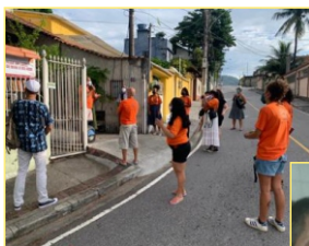
Participação do SindipetroRJ na inauguração da Biblioteca Popular Carolina Maria de Jesus, em Casadura