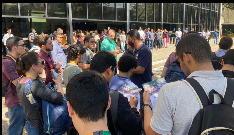
Registro de assembleias no CENPES e EDIHB: trabalhadores estão mobilizados