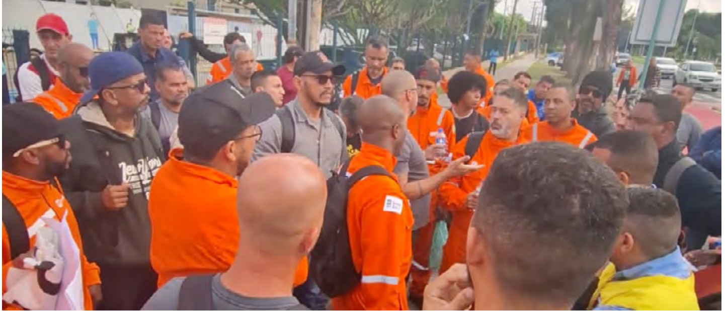
Mobilização dos trabalhadores da LCD no CENPES