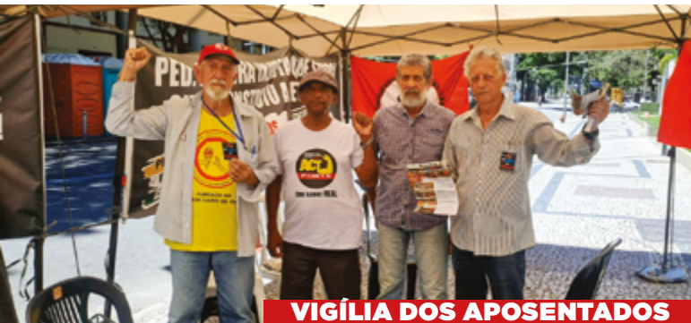
VIGÍLIA DOS APOSENTADOS

APOSENTADOS - A nova Proposta trazida pela Petrobrás não contempla os aposentados, que reivindicam a recomposição de perdas e o pagamento da dívida da Empresa com a Petros para não terem que continuar arcando com Planos de Equacionamentos que atingem principalmente o poder aquisitivo de aposentados. Eles permanecem em vigília, acampados, desde o dia 11/12 na porta de entrada do EDISEN.