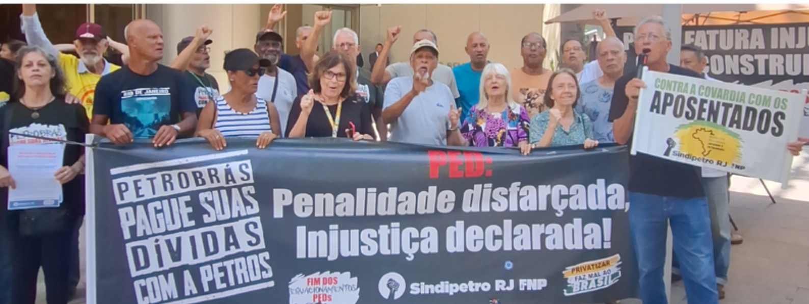
Aposentados protestam em frente à sede da Petros no Centro do Rio de Janeiro

É de fundamental importância que todos participem dos atos que o Sindipetro-RJ vem realizando em frente à sede da Petrobrás (EDISEN) e em frente à sede da Petros (Edifício Porto Brasilis)