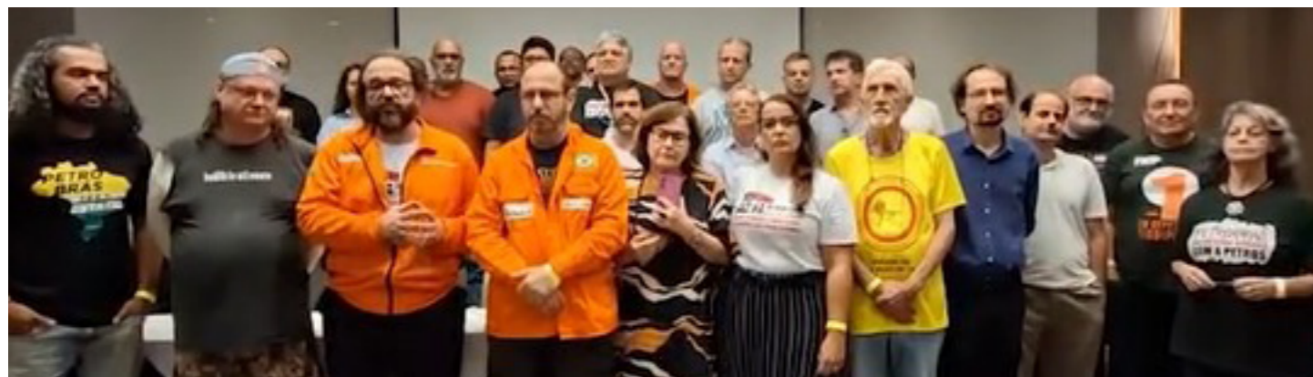
Reprodução de vídeo

Diretoria Colegiada debateu conjuntura e movimentos sociais e avaliou as pautas e perspectivas para os próximos embates no Sistema Petrobrás, bem como aspectos mais ligados à administração do sindicato